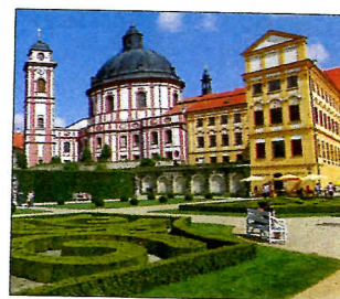
Zámek Jaroměřice nad Rokytnou

Prohlídky zámku se zúčastnil _____ obě třídy i jejich vyučující. Obě třídy i jejich vyučující se zúčastnil _____ prohlídky zámku. Na mýtině u lesa se pásl _____ laně, jeleni a mufloni. Laně, jeleni a mufloni se pásl _____ na mýtině u lesa. Nad rozkvetlou loukou poletoval _____ včely a motýli. Včely a motýli poletoval _____ nad rozkvetlou loukou. V divadle byl _____ obsazen _____ všechna sedadla i přistavené židle. Všechna sedadla i přistavené židle byl _____ v divadle obsazen _____. Ve sportovní soutěži reprezentoval _____ naši třídu Monika, Klára, Roman a Petr. Monika, Klára, Roman a Petr reprezentoval _____ naši třídu ve sportovní soutěži.