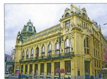
Obecní dům v Praze

Obecní dům v Praze, obec Dolní Město, budova Karolina, chráněná krajinná oblast, Křížový pramen, restaurace (není součástí názvu) U Tří lip, rovník, zeměkoule, planeta Saturn, obec Nová Ves u Světlé, arcivévoda habsburský, indián, Šemíkův skok, Pobřeží slonoviny, ulice Na Spravedlnosti, náměstí Bratří Čapků, Království dánské, dům U Minuty, parlament, Těšínsko, sídliště Jižní Město, mikroregion Střední Polabí, kraj Královéhradecký, opera Rusalka, nebešťan, Havlíčkovo náměstí.