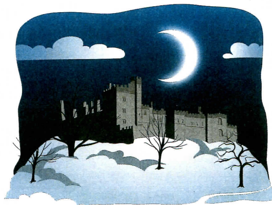
(Charlotte Brontëová: Jana Eyrová – upraveno)

Mrzlo až praštelo jak svědčil ledov povlak na kamenech v místech kudy se přes ně po náhlé oblevě přeléval potůček nyní zamrzl . Měla jsem odtamtud vyhlídku na Thornfield [Tornfild]: ten šediv pánův dům s cimbuřím byl ohniskem celého údolí a za ním se na západě zdvíhal k obzoru temn hol sad a les. Zůstala jsem tam sedět dokud slunce nezapadlo mezi kmeny stromů jako jasn komínov kotouč. Na vrcholku kopce přede mnou stál vycházející měsíc zatím ještě bíl jako obláček ale každým okamžikem jasnější. V tichém podvečeru bylo slyšet zurčení nejbližších potoků i hukot těch nejvzdálenějších.