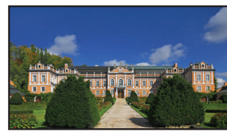
Zámek Nové Hradky